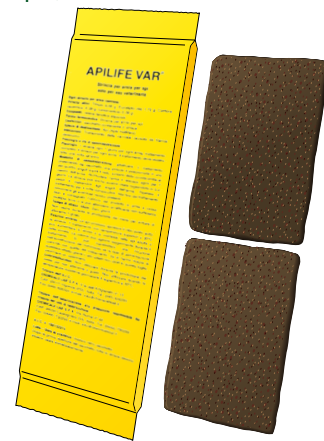
1 sachet = 2 plaquettes.

A base d'huiles essentielles (HE d'Eucalyptus, de Thymol, de Lévémenthol, de Camphre racémique)